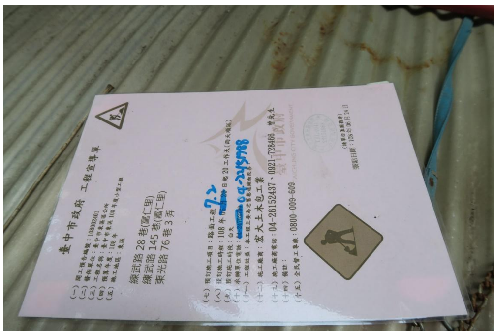
工區七 旱溪里東光路 76 巷 3 弄路面改善工程施工地點張貼之工程宣導單