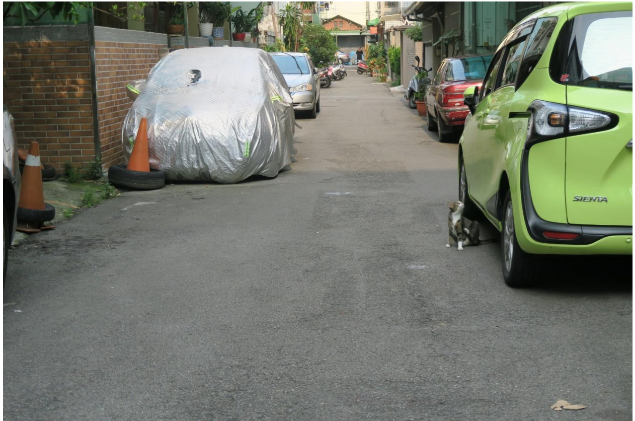
工區十一 合作里自強街 27 巷路面改善工程施工地點現況照片 108 年 8 月即將施工改善路面 (自強街至力行路 52 巷 上圖：自強街巷口 中圖：巷內叉路 下圖：力行路 52 巷巷口)