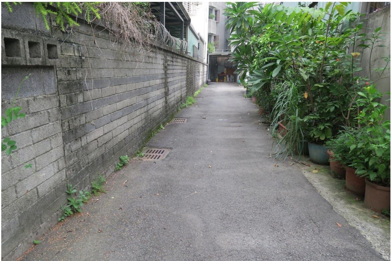
工區十 東英里精武東路 150 巷路面改善工程施工地點現況照片 108 年 8 月即將施工改善路面( 上圖：巷口 中圖上：巷內右邊第一個小弄 中圖中：巷內左邊第二個小弄 中圖下：巷內轉彎處 下圖：轉彎處至巷底 )