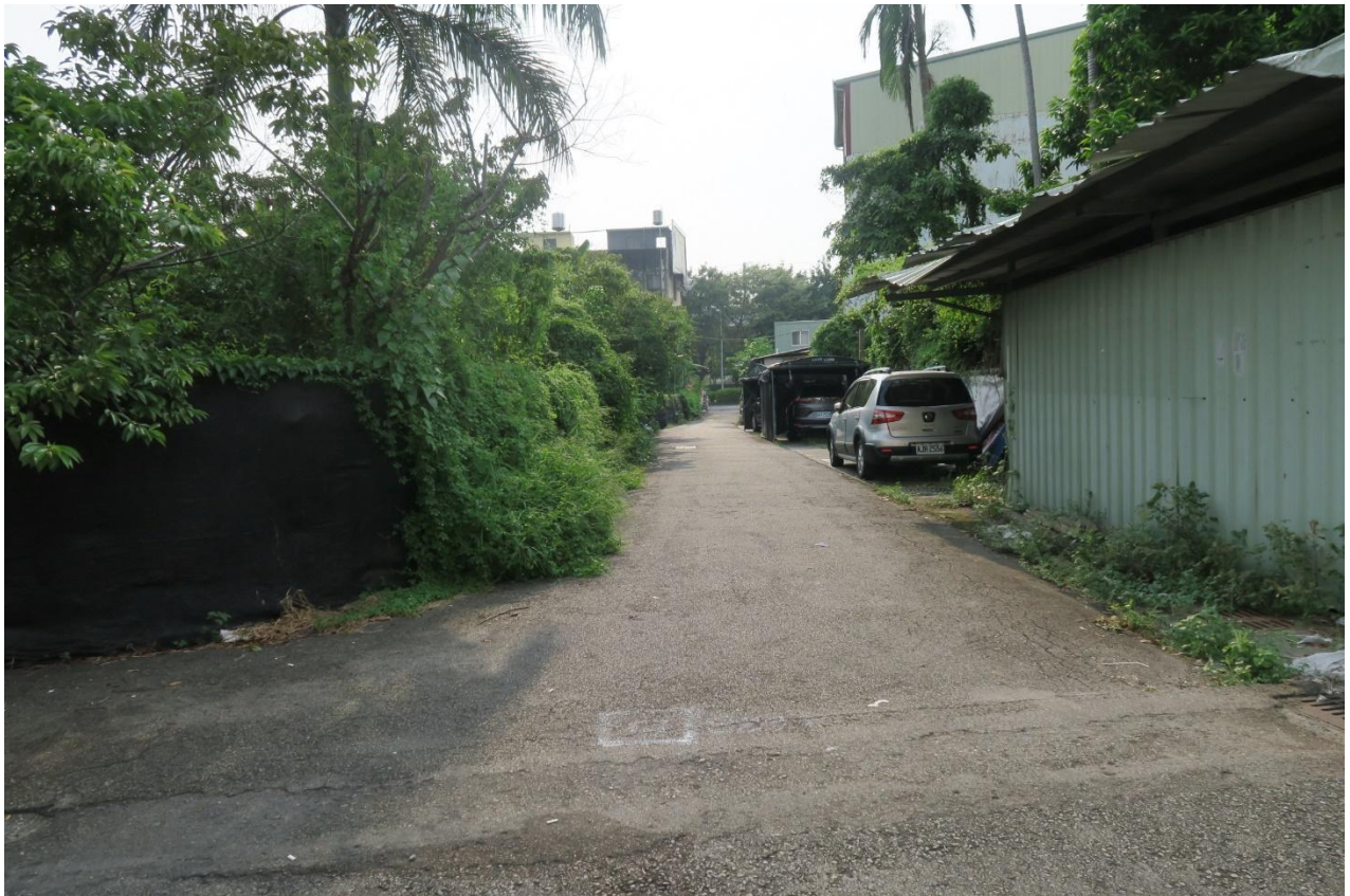
工區六 旱溪里東光路 76 巷路面改善工程施工地點現況照片 108 年 8 月即將施工改善路面 (東光路至旱溪五街 上圖：東光路巷口 下圖：旱溪五街巷口)