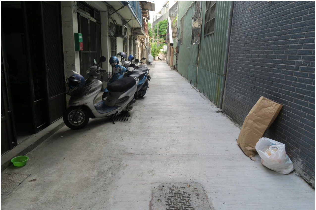
工區七 旱溪里東光路 76 巷 3 弄路面改善工程完工照片 ( 上圖：弄底 中圖：弄底轉彎處 下圖：轉彎處至弄口 )