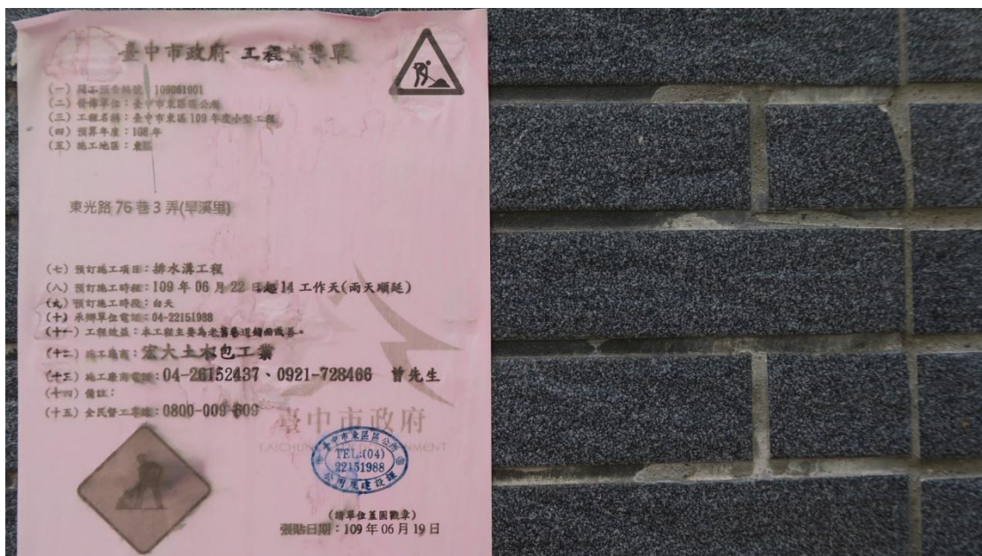
工區八旱溪里東光路 76 巷 3 弄排水改善工程