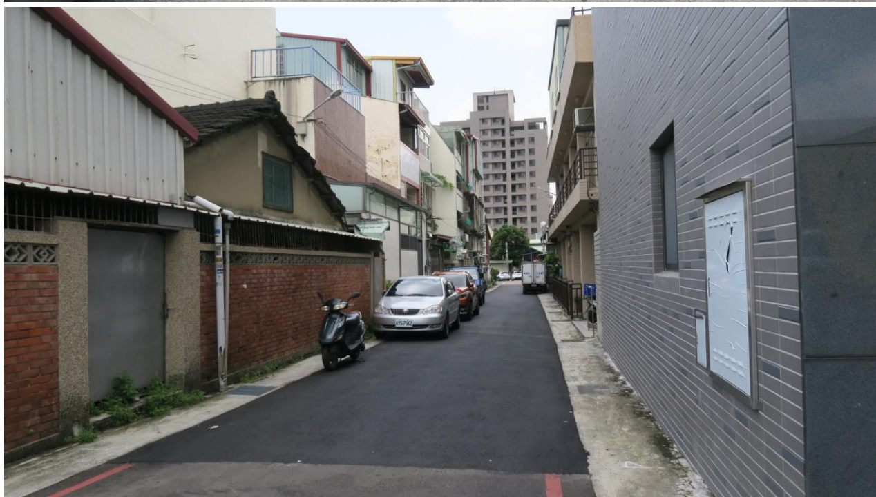
工區十一 泉源里樂業路 105 巷 ( 樂業路至建成路 336 巷 ) 路面改善工程施工地點現況照片