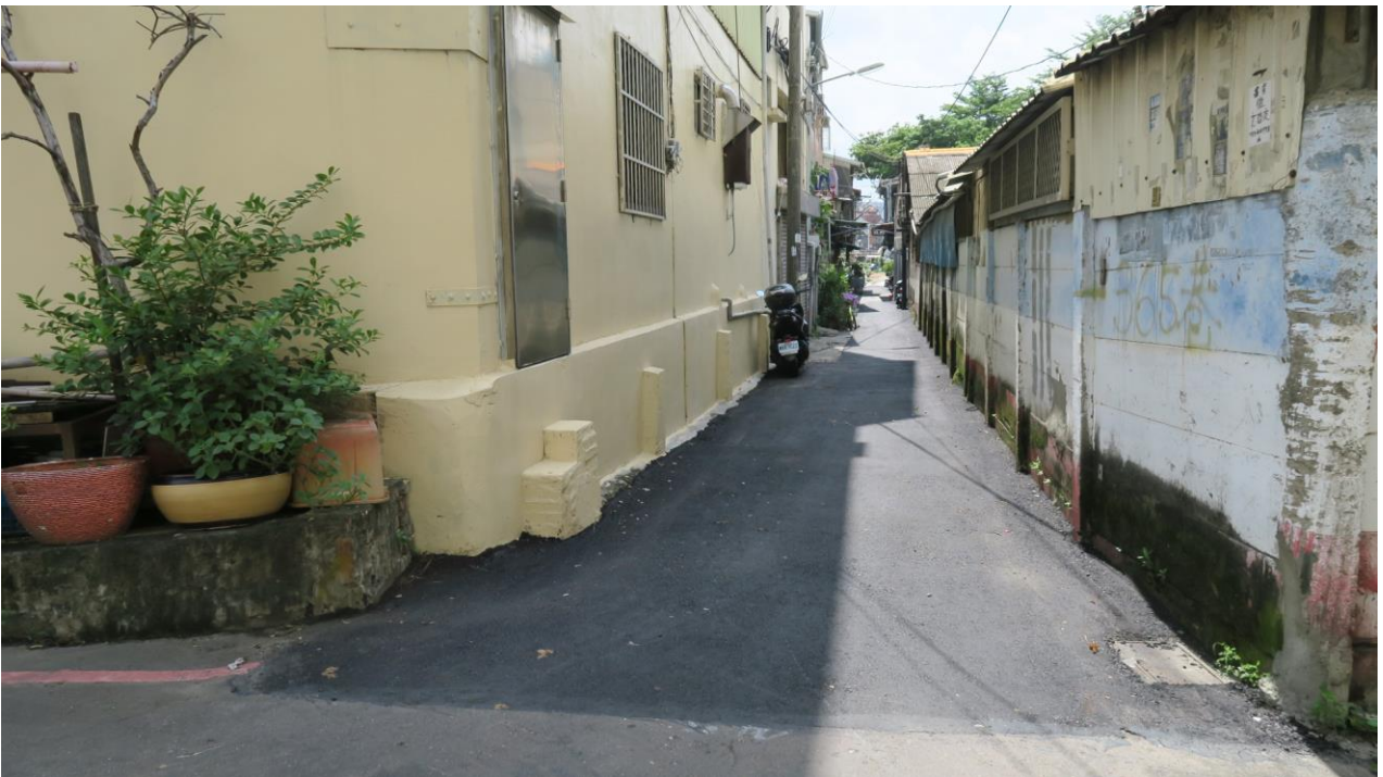
工區五 樂成里旱溪西路一段 365 巷 (旱溪西路一段至樂業路 238 巷) 路面改善工程施工地點現況照片