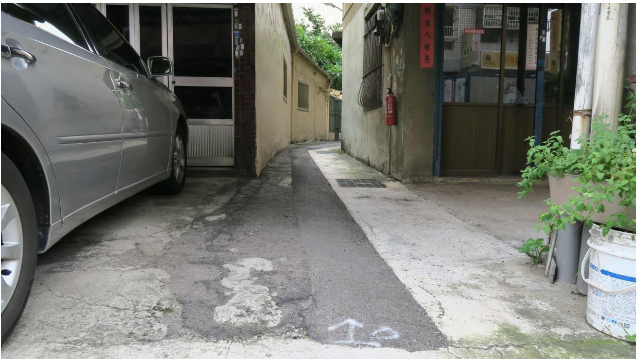
工區九 新庄里和平街 204 巷 ( 和平街至信義街 ) 路面改善工程施工地點現況照片 ( 預定 110 年 8 月或 9 月完工 )