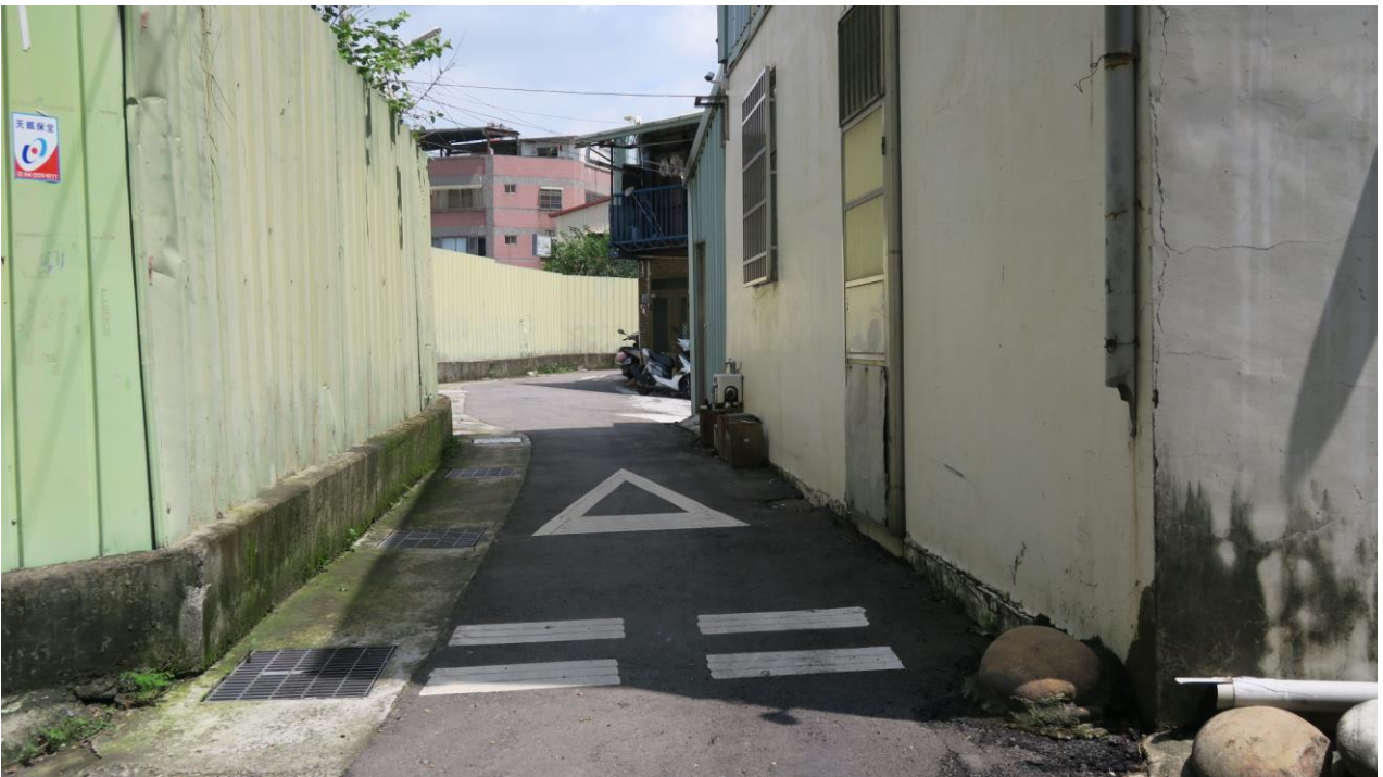
工區六 樂成里樂業路 238 巷（樂業路至育英路）路面改善工程施工地點現況照片