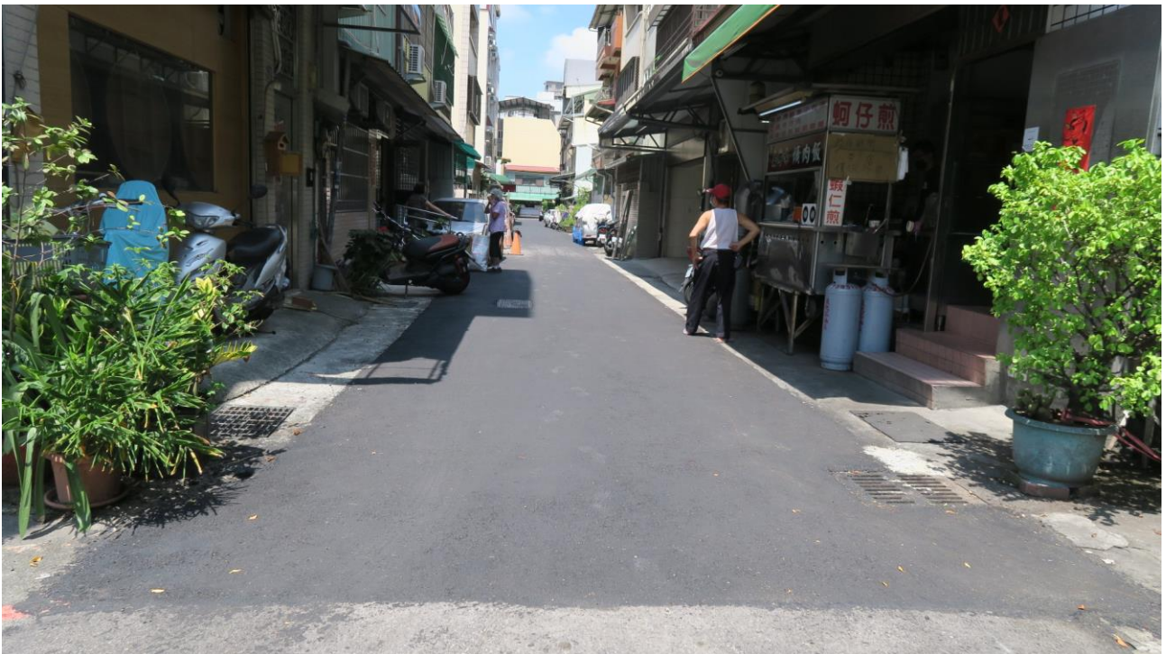
工區十六 合作里自強街 22 巷 ( 自強街至南京東路一段 ) 路面改善工程施工地點現況照片