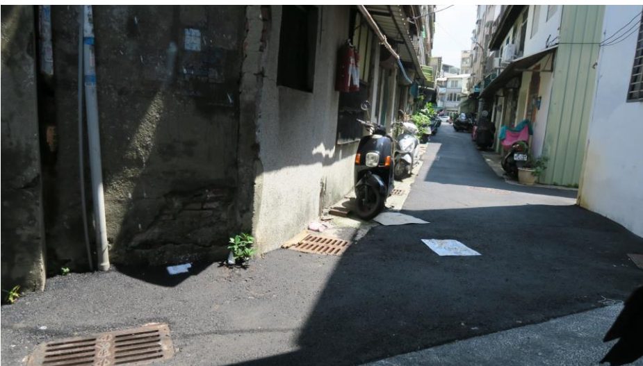
工區十五 東勢里進德路 20 巷 ( 含進德路 40 巷 6 弄 ) 路面改善工程施工地點現況照片