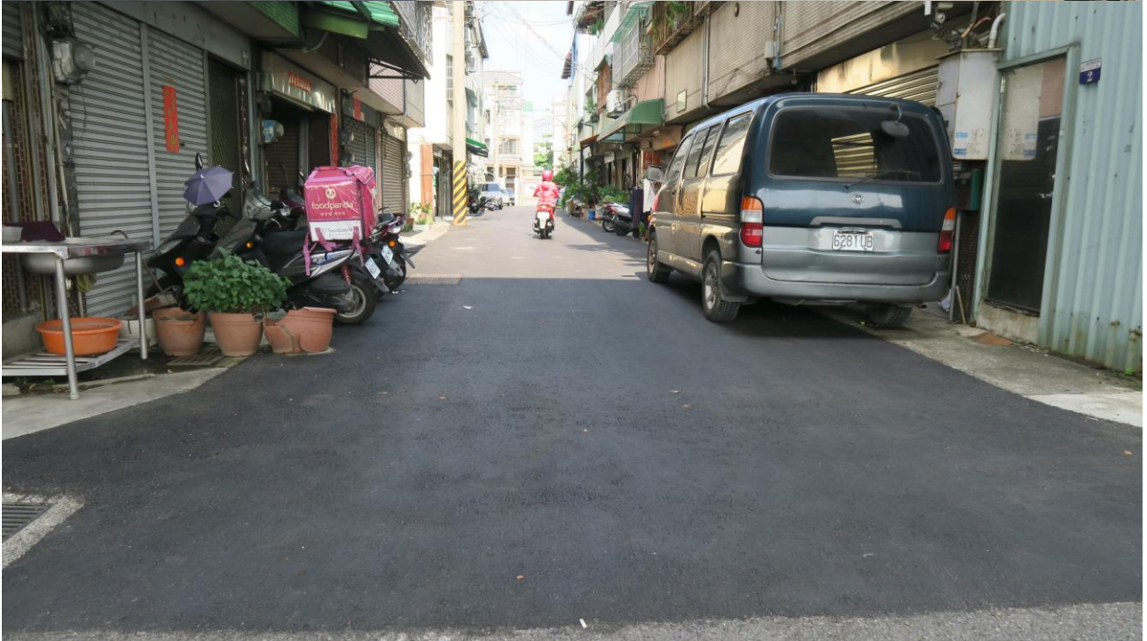
工區十二 東信里環中東路四段 900 巷 ( 振興路 437 巷至環中東路四段 ) 路面改善工程施工地點現況照片