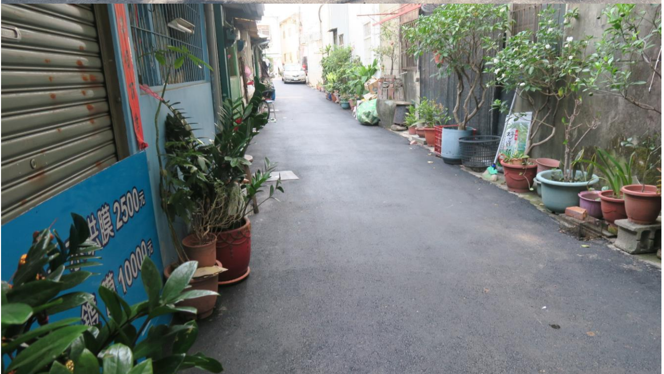
工區十四 旱溪里十甲路 64 巷路面改善工程施工地點現況照片