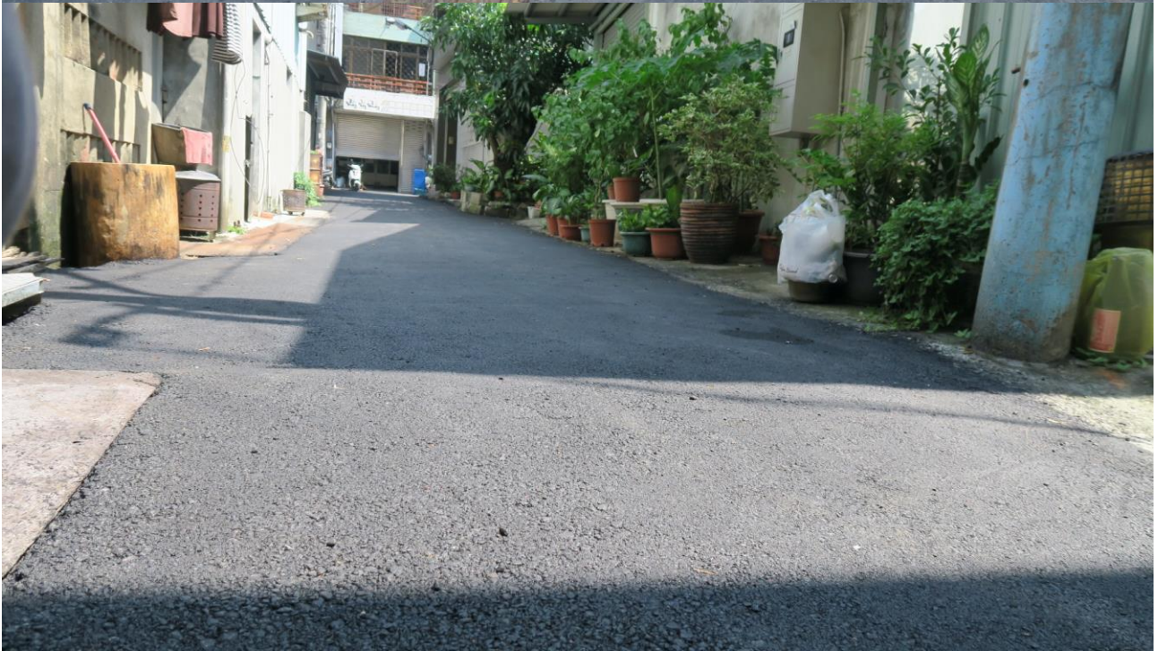
工區十三 旱溪里十甲路 4 巷路面改善工程施工地點現況照片