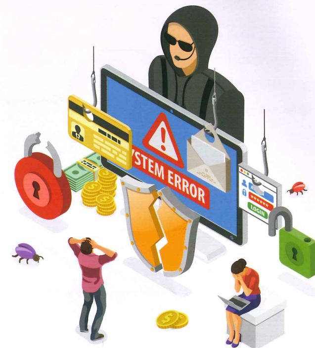
「鑑識」就是將犯罪現場、證據及受害者與嫌疑人之間的關係與來龍去脈描述清楚。

了解數位鑑識與證據之關係後，最重要的是如何從眾多的證據中找到足以證明犯罪的事實；另一方面是利用數位鑑識工具及方法所萃取出來的證據，好好保存以免失去其證明犯罪之證據力及證明力。其中證據力，是一個水平的概念；證明力，則是垂直的概念。掌握愈多證據，愈多元化，就有愈強的證據力。而什麼是垂直的證明力？你可以從一根頭髮，判斷他是男生或女生（第一層）、年齡層（第二層），或是分析出這個人有哪些疾病（第三層），掌握愈多層次，代表證據證明力愈強！